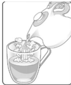
Adăugați apă fierbinte